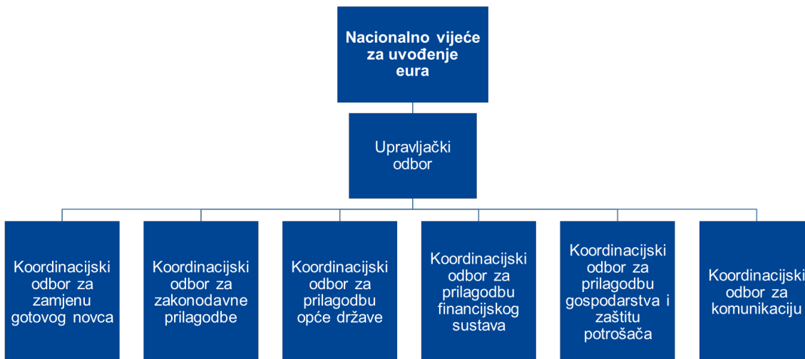
Slika 1. Koordinacijska tijela u postupku uvođenja eura